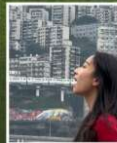
กิบรตไฟฟ้ากะลุตึก