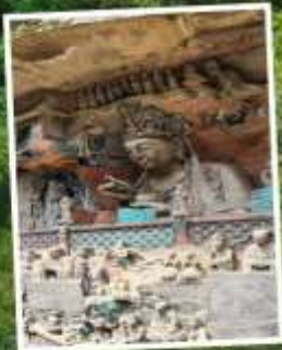
พระพุทธรูปหิน แกะสลักต้าจู่