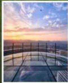
RAFFLES CITY CHONGQING