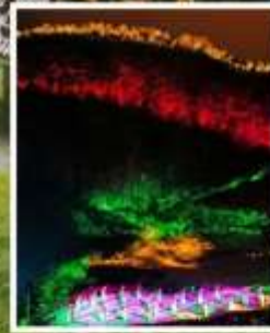
โชว์ IMPRESSION WULONG