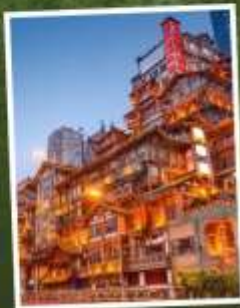
ห้างหงหยาดัง