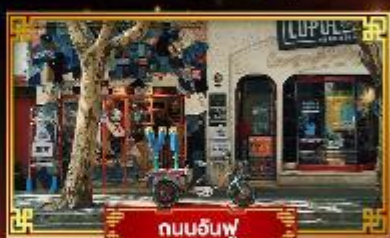
ถนนฉินฟู่